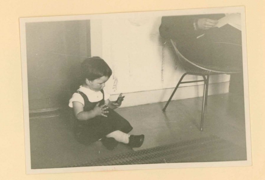
By tomte hock op haar kamer.