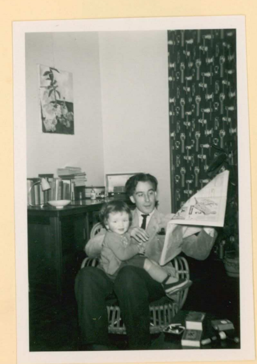
3/3 met om aimé