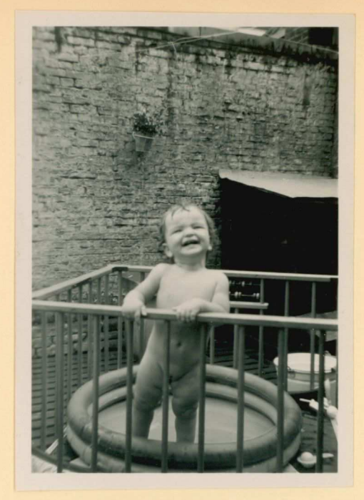
17 aug. '58