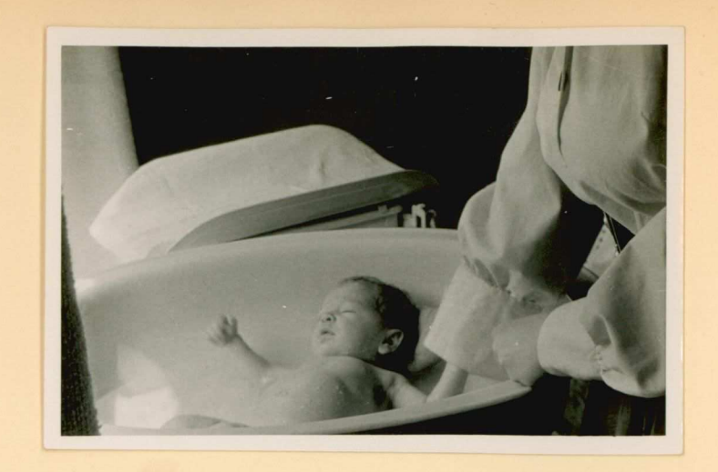
12 Mei 1957