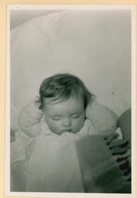
ndyrammaelt 5/58. No slaap ik non alkijde. 0.30 mm