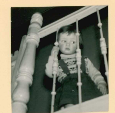
Wie komt er in mign huisje? –