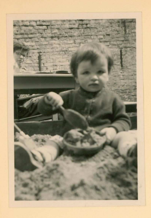
· 5 morgans