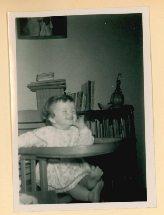
Juli 58 Zomaar....