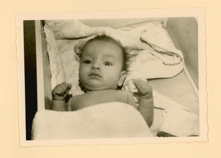
sind Juli 1957. 31/2 mud ond. Met Mit 4 badge