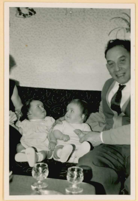
met heisbethje op de Kanent. laan