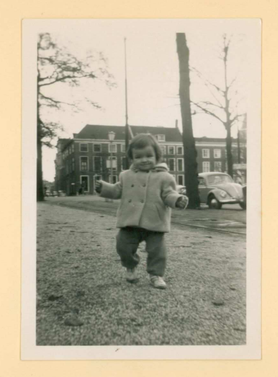
1 november, 58