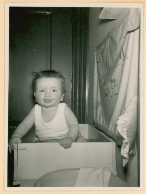
The cle commode, Voor 't slapen gaan