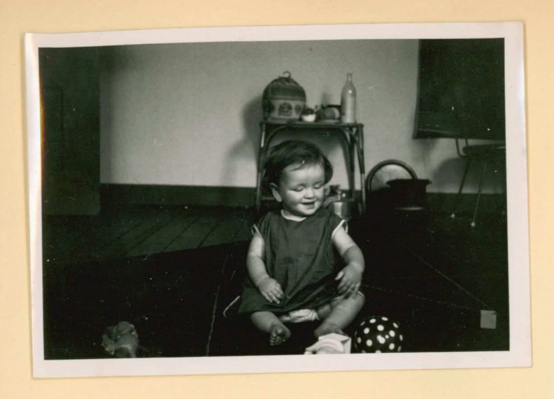
lante hoes maakt foros.