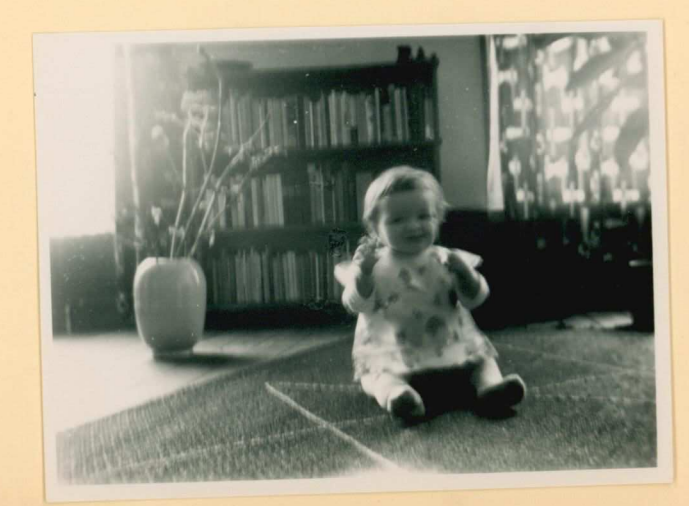
5 april 1958