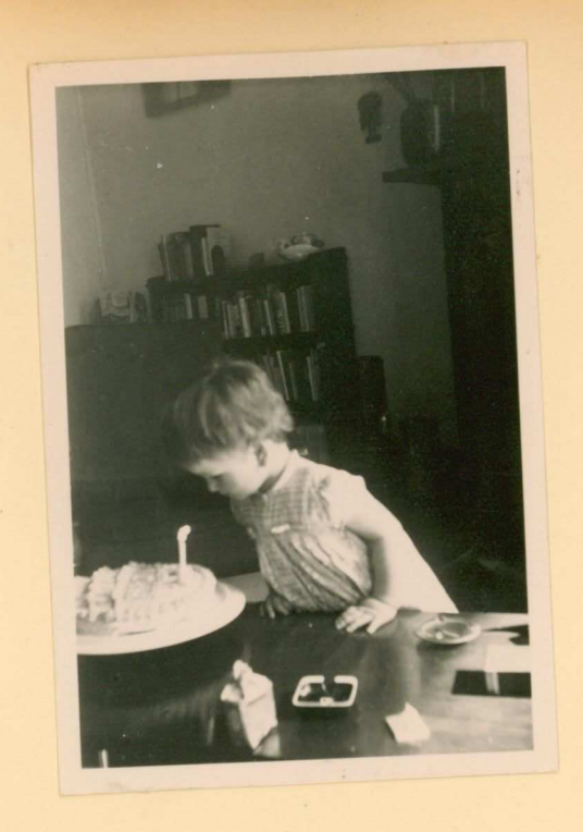
Je verjaarstaart 12-4-59