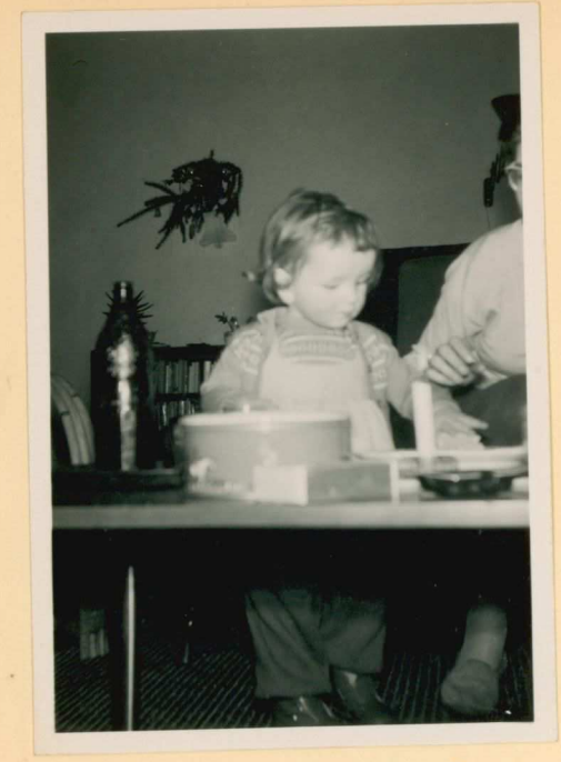
2º kerst day '58