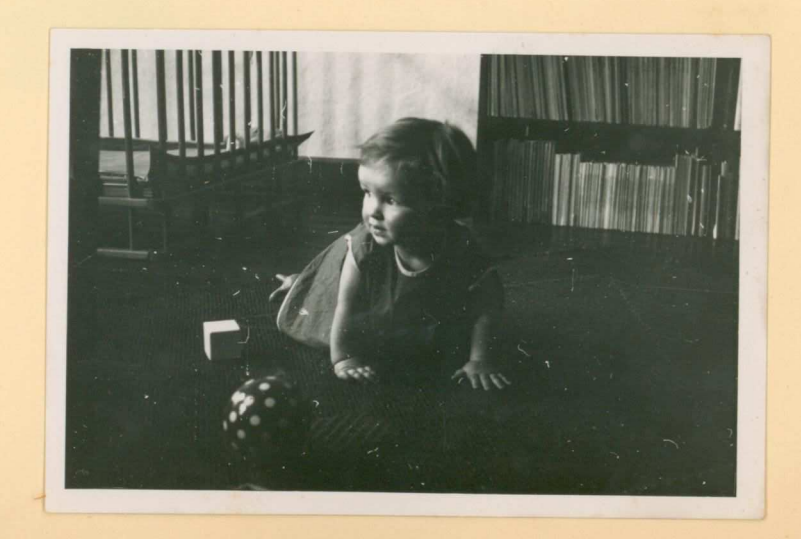
19 Juni 1958 (14 maranden).