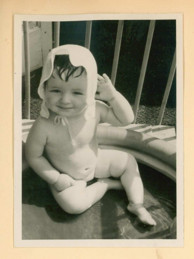
Eind juli 158