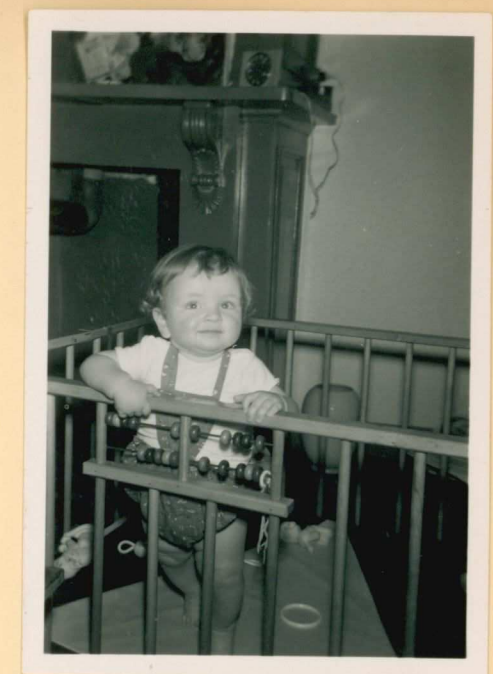
begin Juni 58