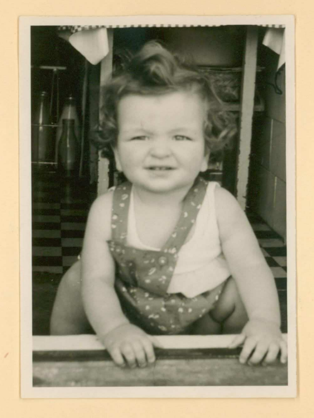
half september '58