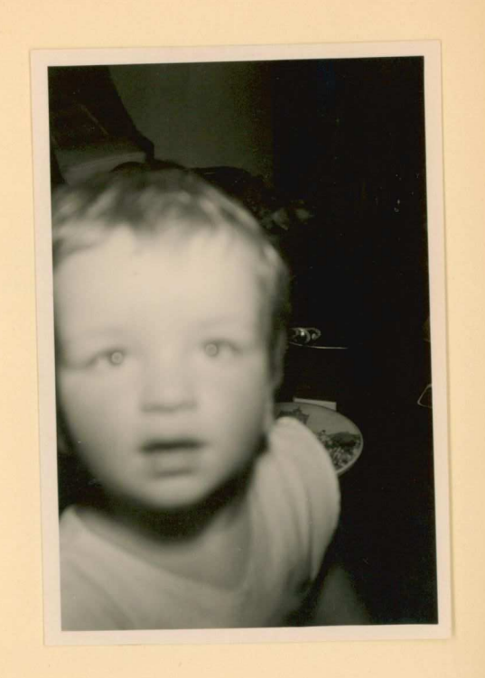
23-7-59 heel dicht by!