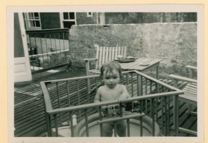
17 Augustus '58