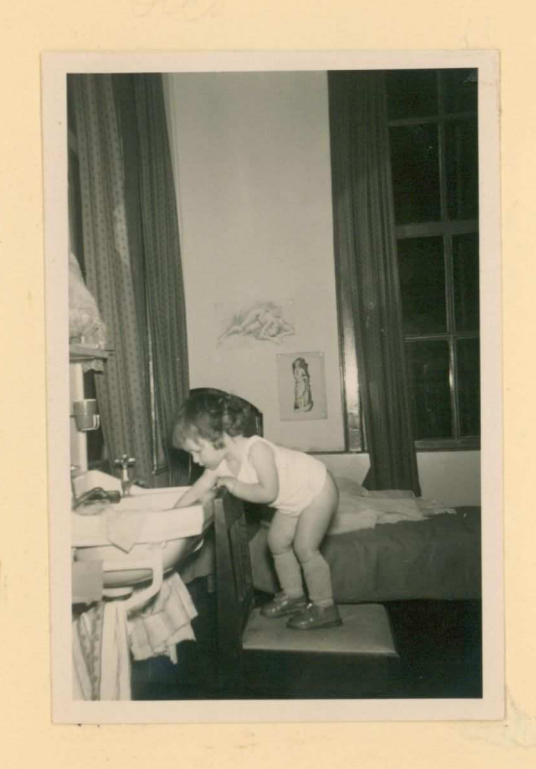
ha de grote schoonmaak.