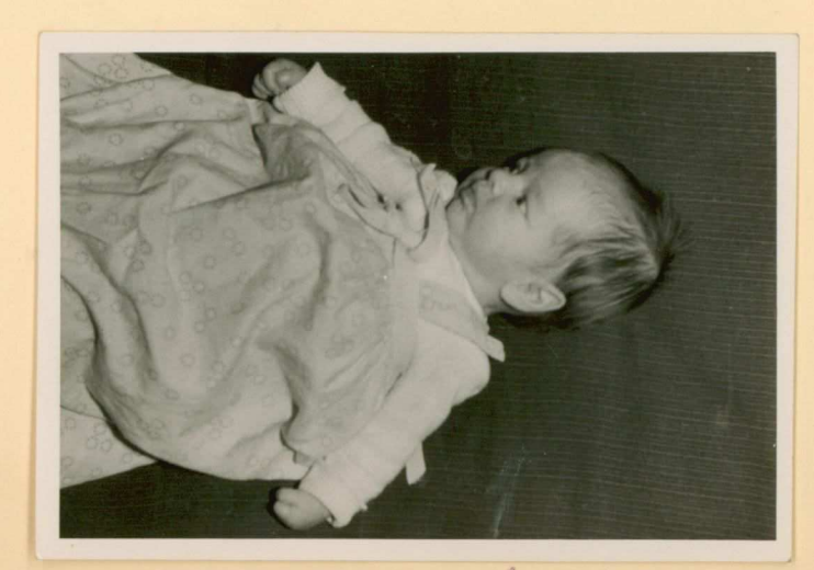
op de bank