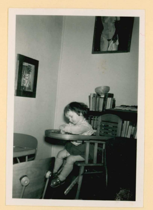
eten, na het eten ----