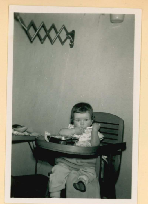
18 mei 1958. (Zeef eten!)