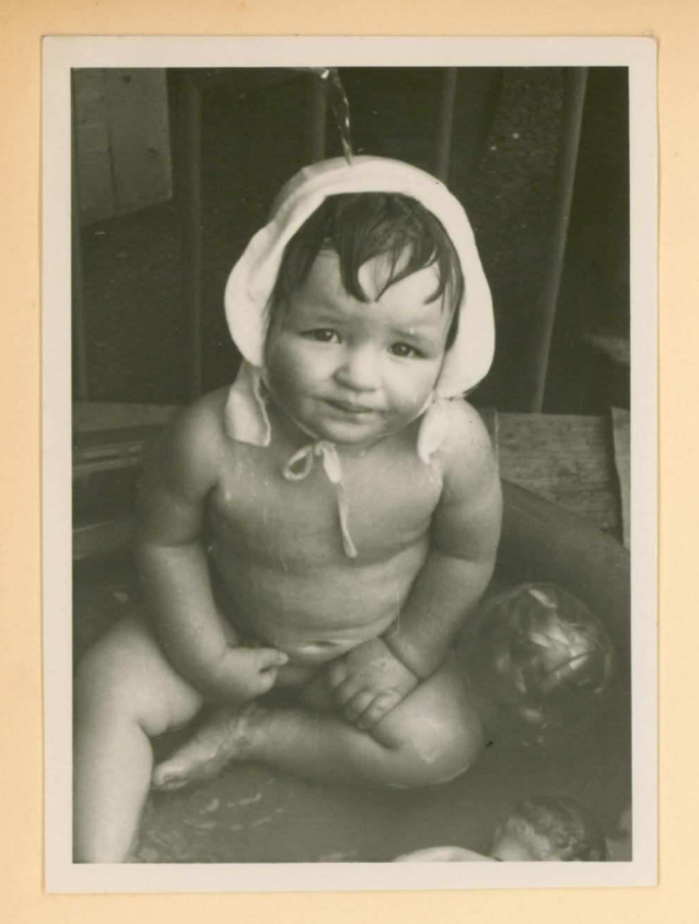
op de Hanenburglaan