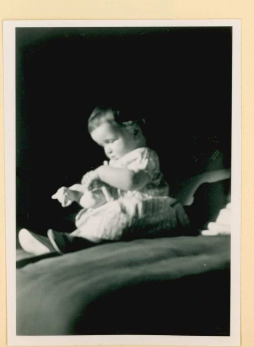
20-4-58. Poen papa in client was