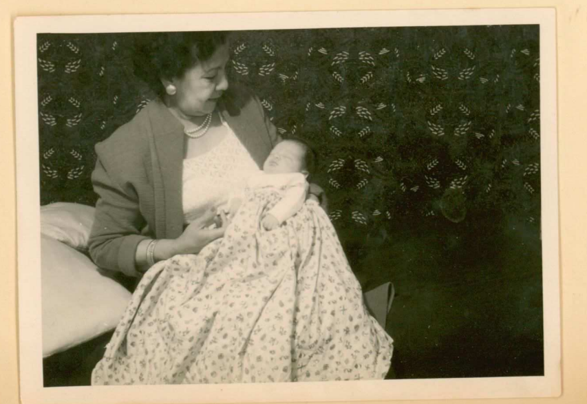
23 april 1957