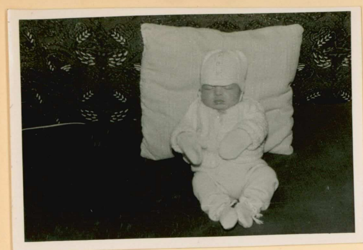
30/5 17 Memelvaartelag. Changebleed om nit te gaan