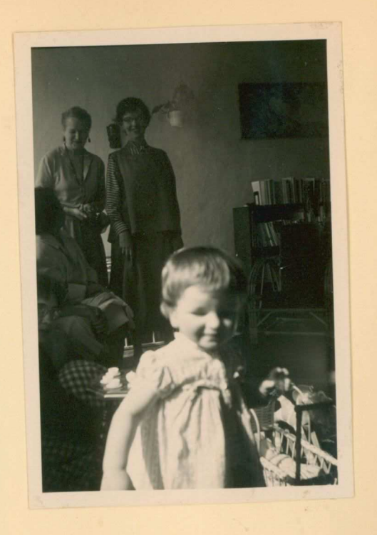
's middags met het nieuwe spelgred!