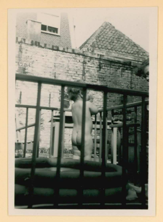
13 Juli 1958