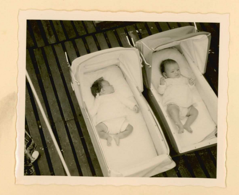
met micht hierhell.