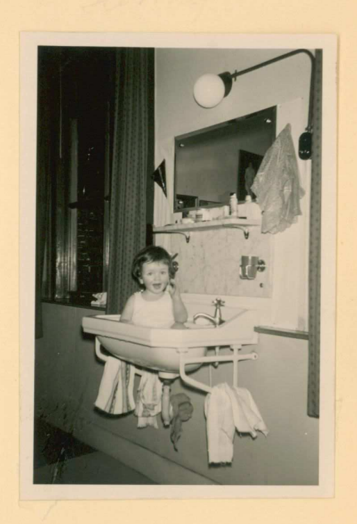
grote schoon maak!