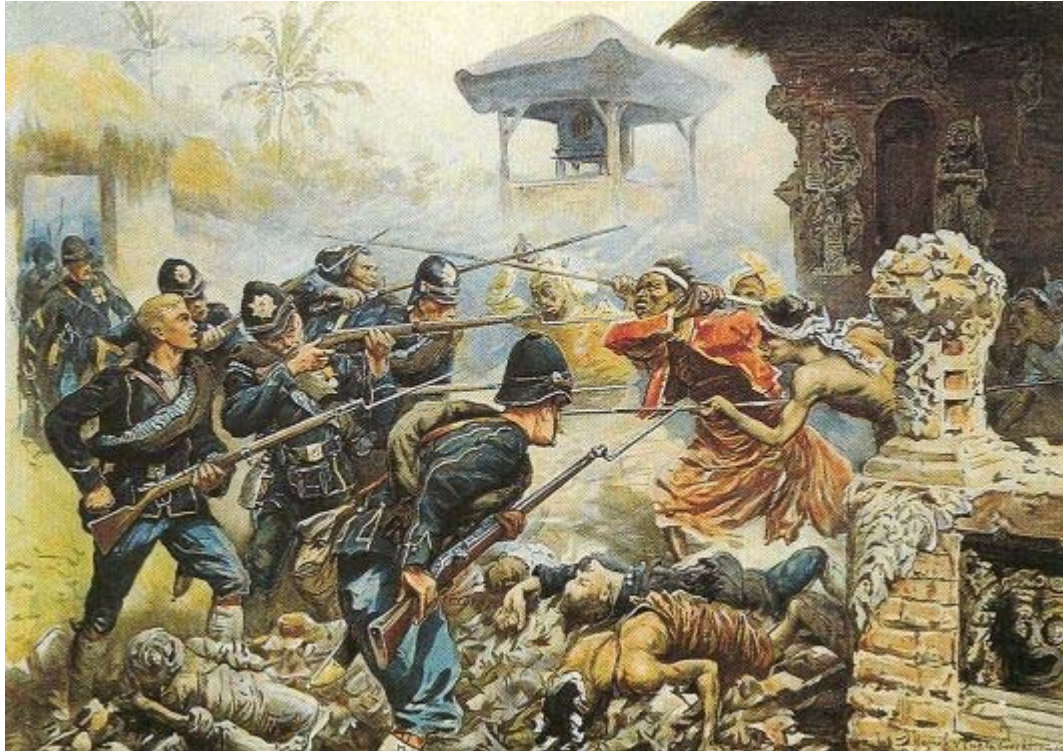
Isings, 'De verovering van Tjakanegara op Lombok, 1894'.

Op de plaat zie je een groepje Nederlandse militairen, kloeke, blonde, besnorde houwdegens. Eén heeft er twee bintangs op zijn jasje, en allemaal stralen ze een koelbloedige kalmte en vastberadenheid uit. Of nee, er staat er één bij in de grootste verwarring, met open mond, de ogen ten hemel opgeslagen. Hij raakte zijn helm kwijt, zo'n hoge, zwarte, met het blinkende embleem erop. En daarmee verloor hij ook zijn zelfbeheersing, en zal hij zelfs zijn leven verliezen, straks, wanneer hij neerzigt naast zijn zojuist gesneuvelde kameraad, die daar al ligt in een rust, die toont hoe rustig dit liggen in een glorieuze dood kan zijn.