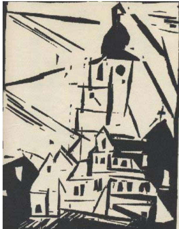
Lionel Feininger, Buttelstedt , 1918.

'C'est la vie', antwoordde hij zonder na te denken. 'Er is veel te doen, we hebben het druk, we moeten opschieten.'